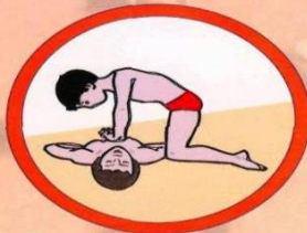
Выполнение непрямого массажа сердца