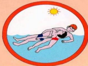
Транспортировка пострадавшего за разноимённую руку