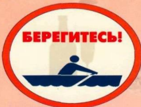
Запрещается употребление спиртных напитков.