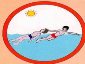
Транспортировка потерпевшего с поддержкой за волосы