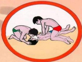
Выполнение одновременно массажа сердца и искусственного дыхания