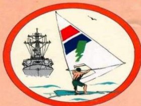
Не пересекайте курс.