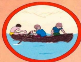
Не перегружайте лодку.