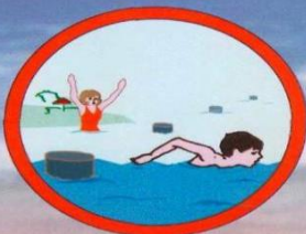
За буйки не заплывать!