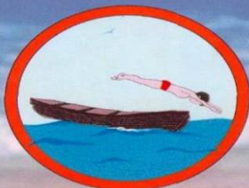
Нырять с лодки нельзя!