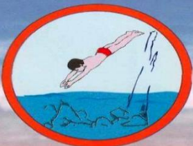
Не ныряйте в незнакомом месте.