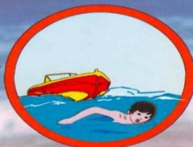
Запрещено плавание в судоходных местах!