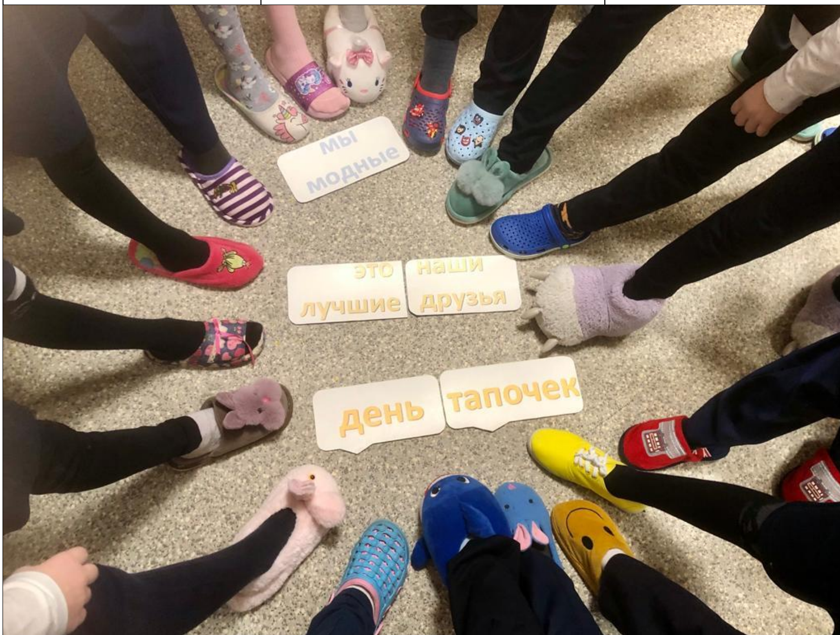
Восьмого декабря прошёл день тапочек!